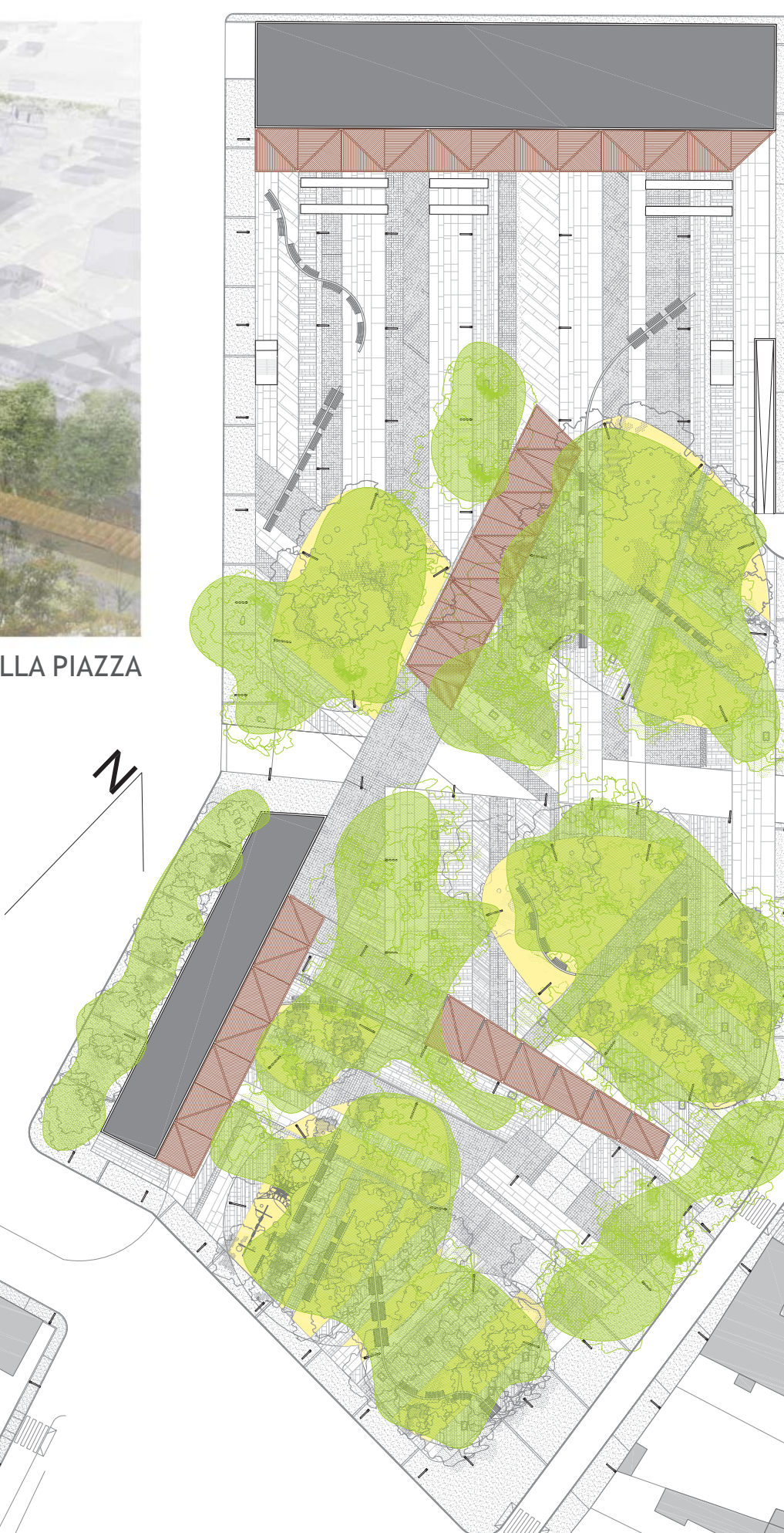
PANTA COPERTURA scala:1/1000