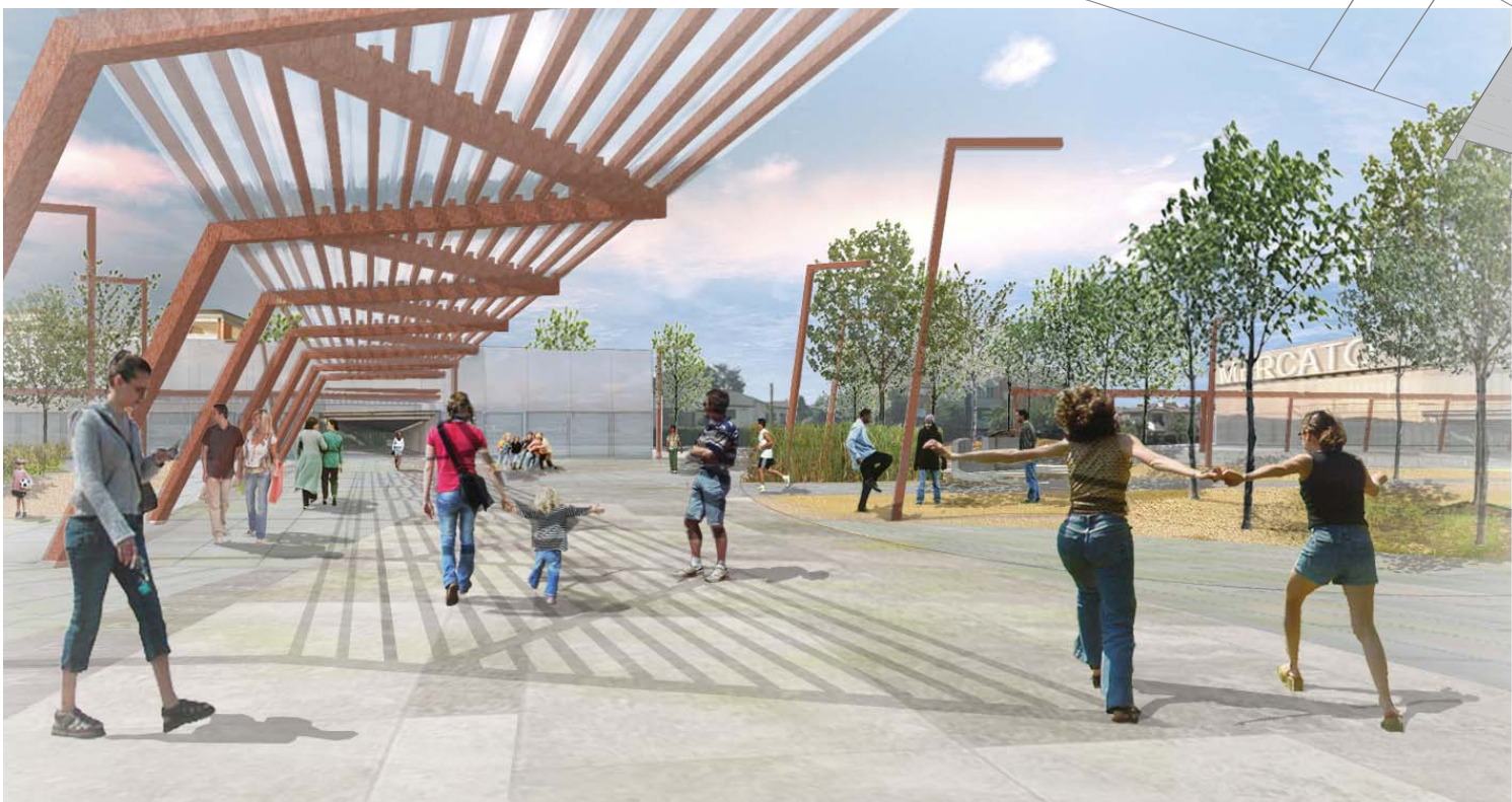
VISTA DELLA PIAZZA-MERCATO