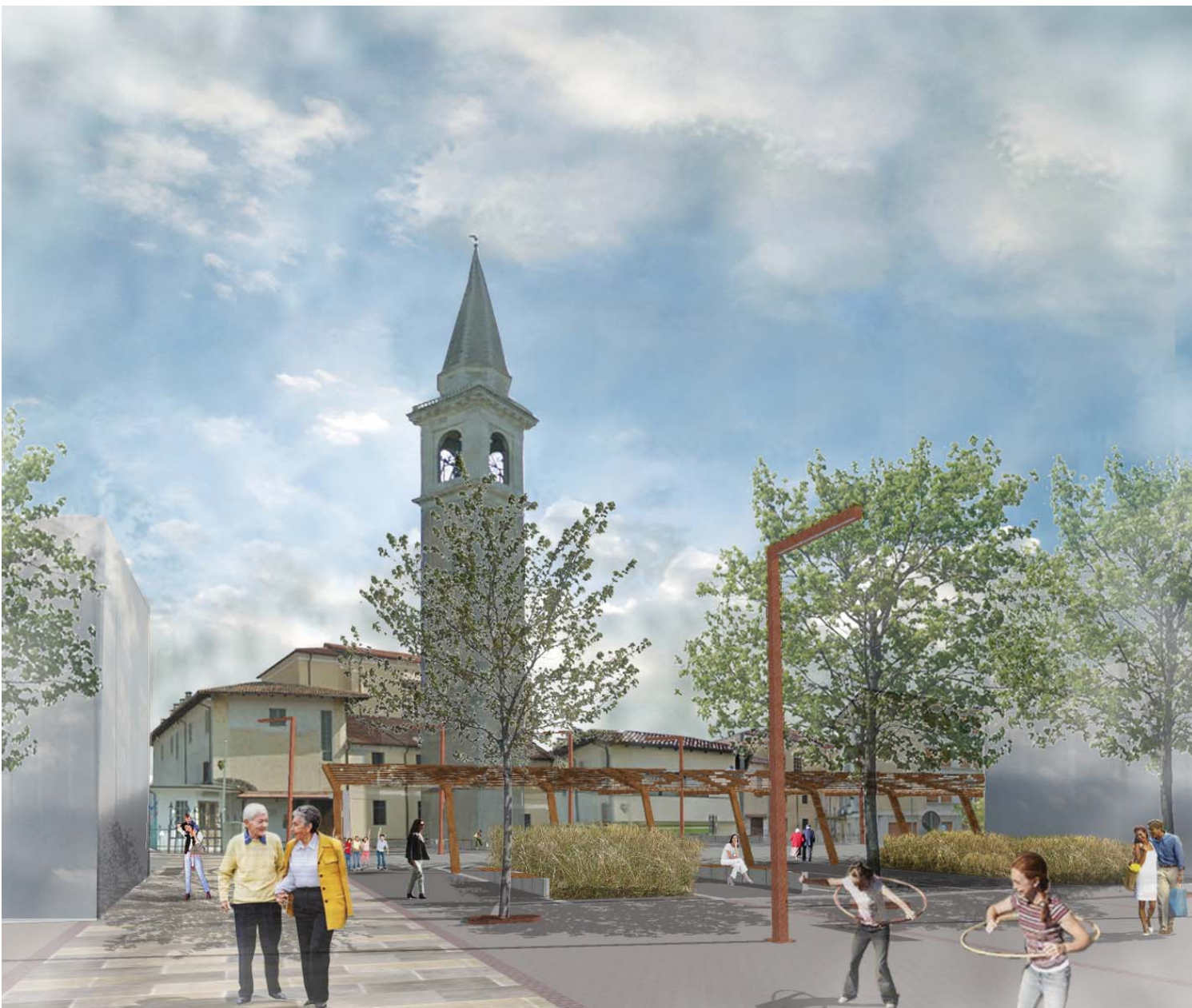
VISTA FRONTALE PIAZZA DEL DUOMO