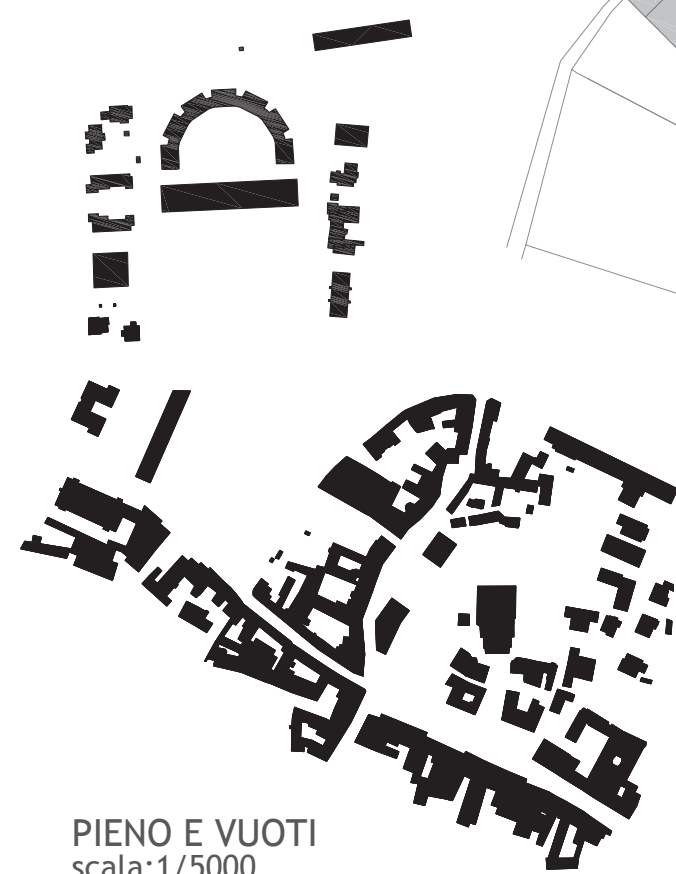
PIENO E VUOTI scala:1/5000