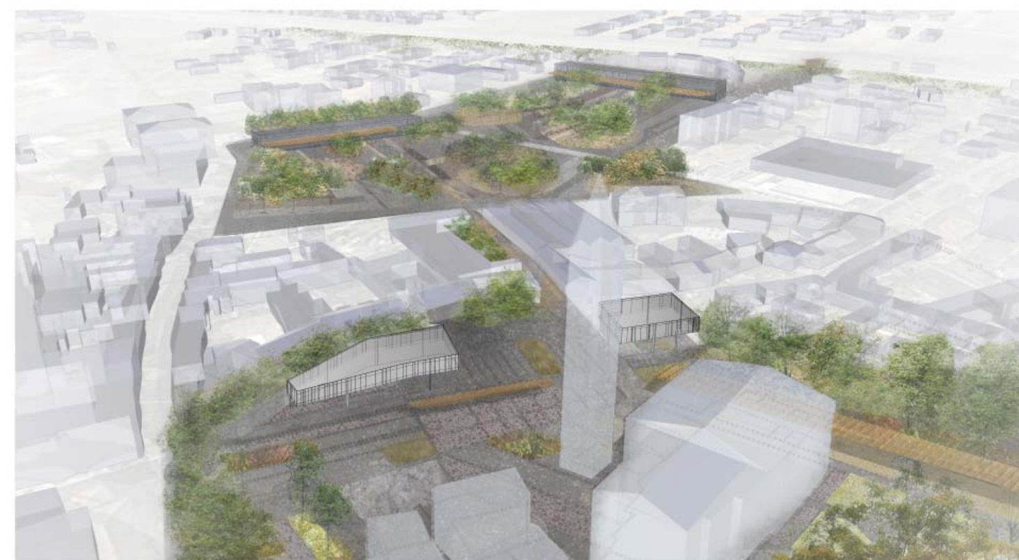
VISTA GENERALE DELLA PIAZZA

ALBERI DI NUOVA PIANTUMAZIONE ALBERI ESISTENTI