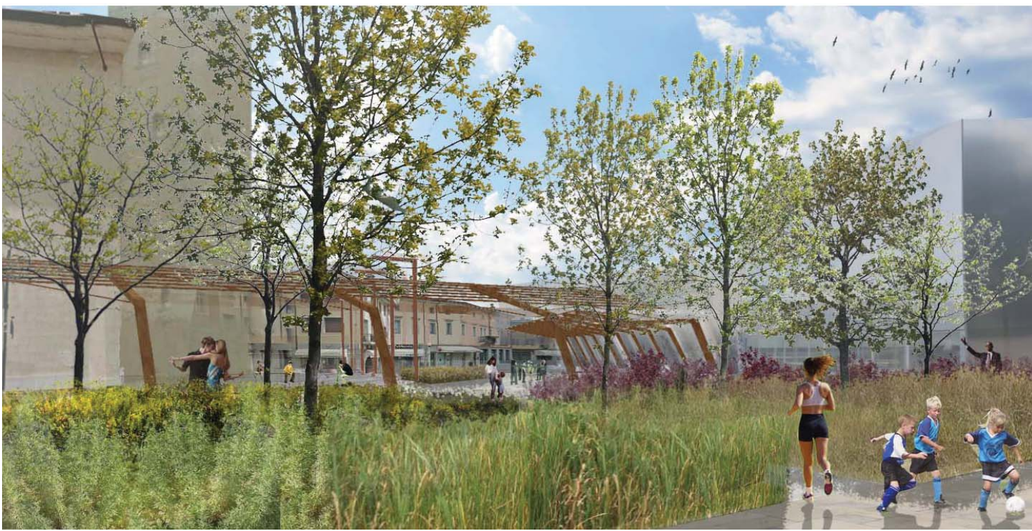
VISTA LATERALE PIAZZA DEL DUOMO