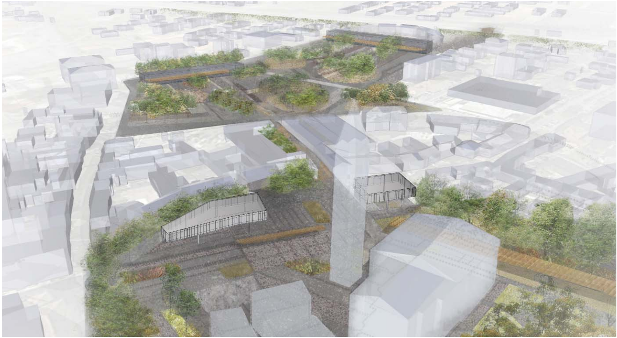
VISTA GENERALE DELLA PIAZZA

I pavimenti saranno prevalentemente di pietra naturale con alcune parti in lastre di cemento e le zone per la circolazione veicolare in asfalto. Alcune aree dalle geometrie più morbide e irregolari saranno destinate per la vegetazione con alberi e alcuni piccole distese di prato.