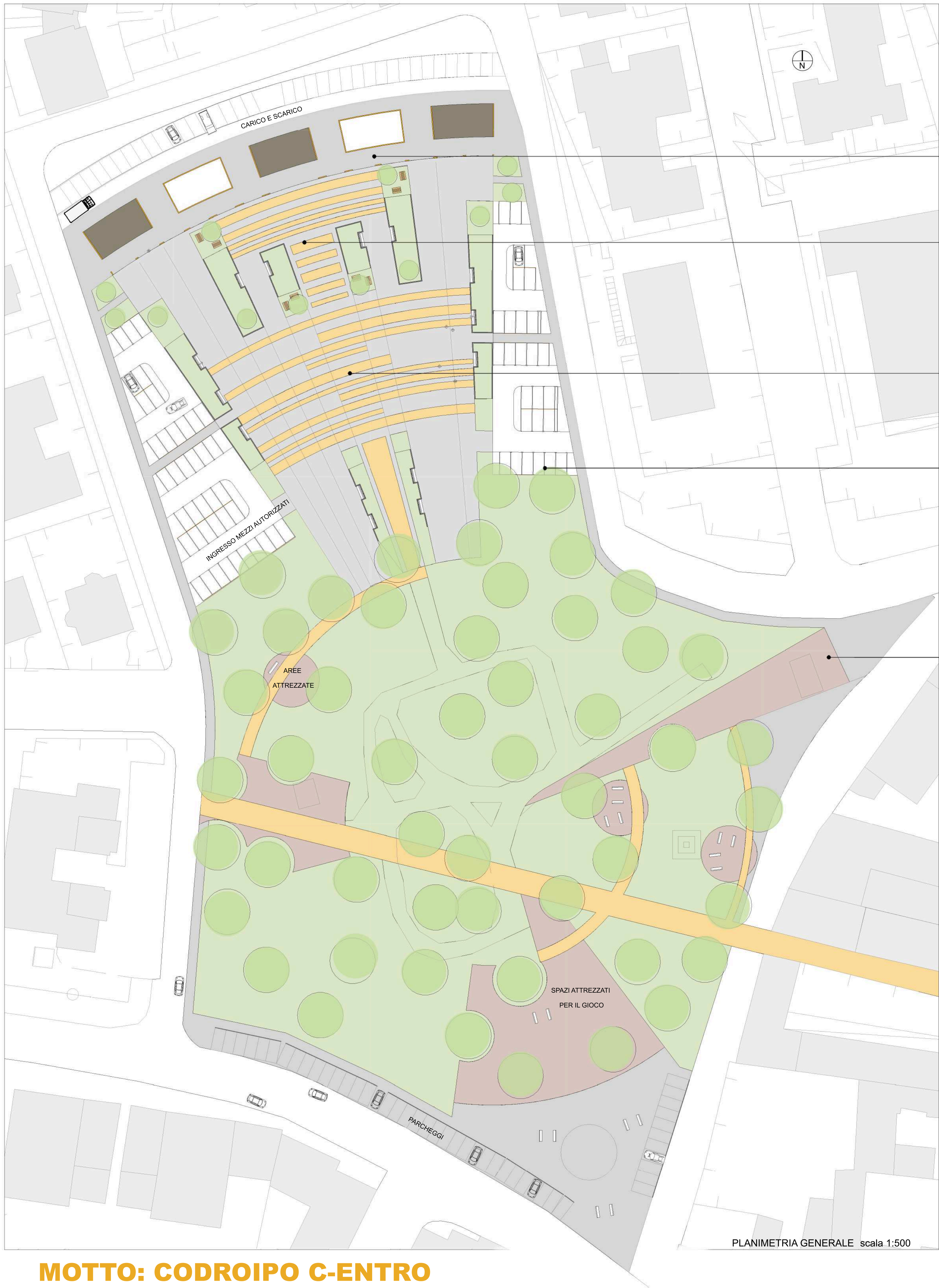
PLANIMETRIA GENERALE scala 1:500