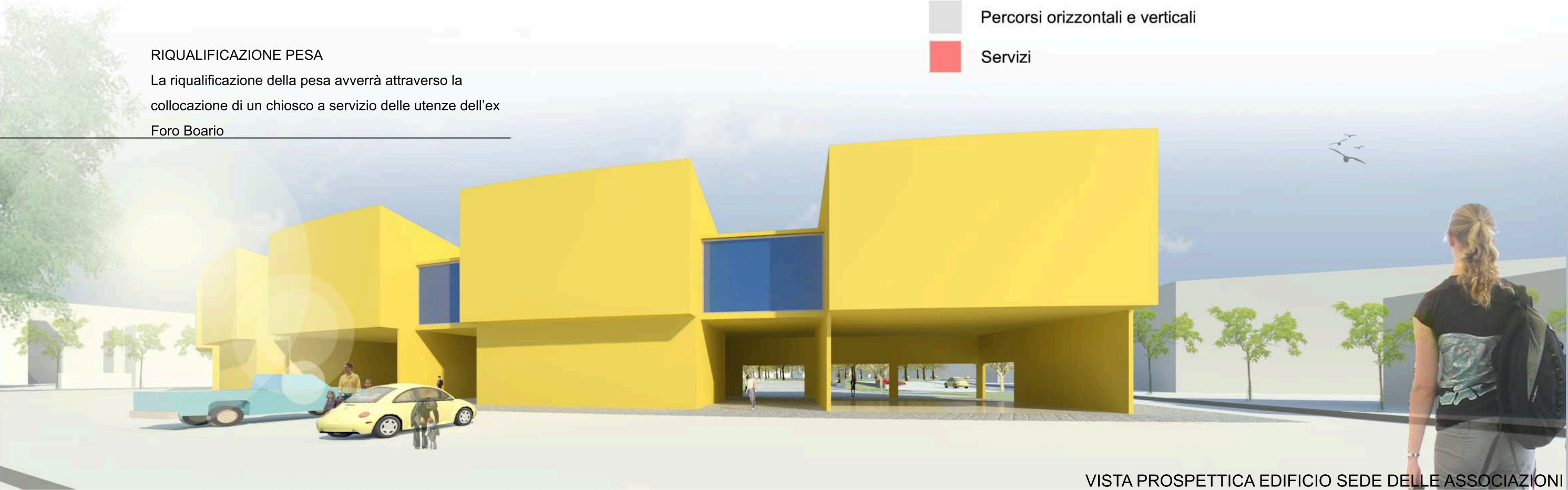
VISTA PROSPETTICA EDIFICIO SEDE DELLE ASSOCIAZIONI