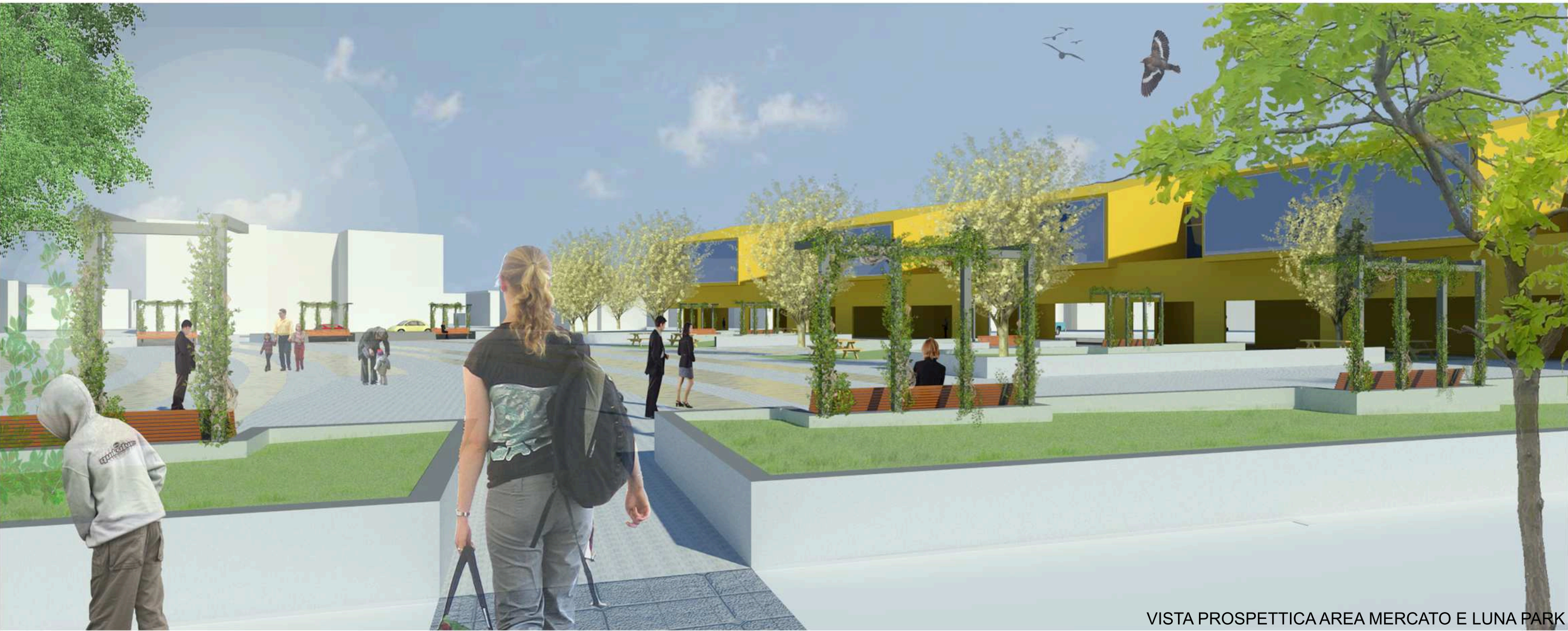
VISTA PROSPETTICA AREA MERCATO E LUNA PARK