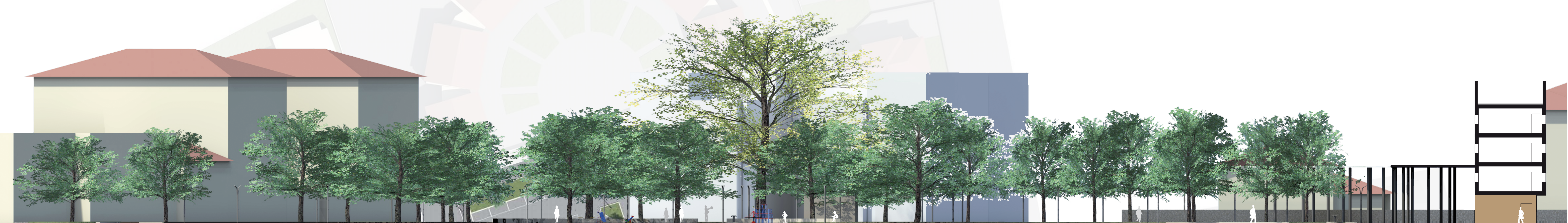
SEZIONE A SCALA 1/200

Vista la numerosa frequentazione dell'area sia in giorni normali per la presenza del parco giochi attrezzato sia in occasione delle fiere, al piano terra abbiamo disposto un congruo numero di servizi igienici pubblici suddivisi in due blocchi uomini/donne separati da un passaggio pedonale che attraversa l'intero edificio.