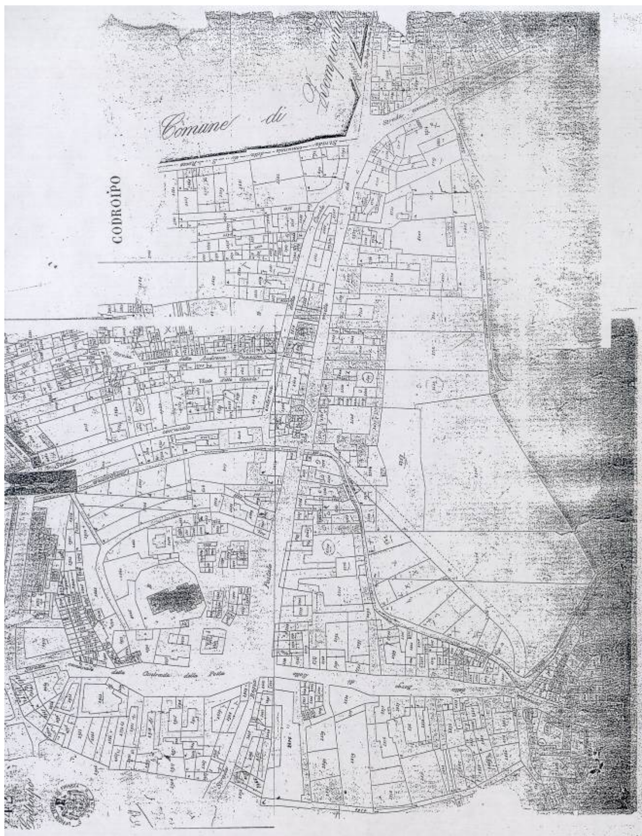
CATASTO AUSTRIACO-ITALIANO ( 1850-1956 )