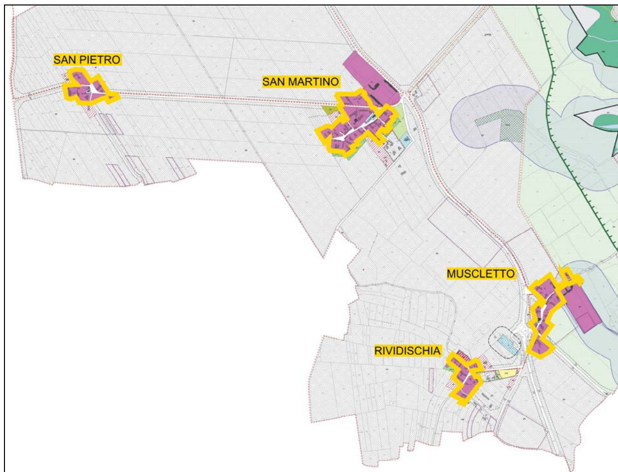
Ambiti soggetti a P.R.P.C. – Estratto P.R.G.C.

Lo strumento attuativo va ad interessare le zone A del P.R.G.C. relative ai centri storici su menzionati.