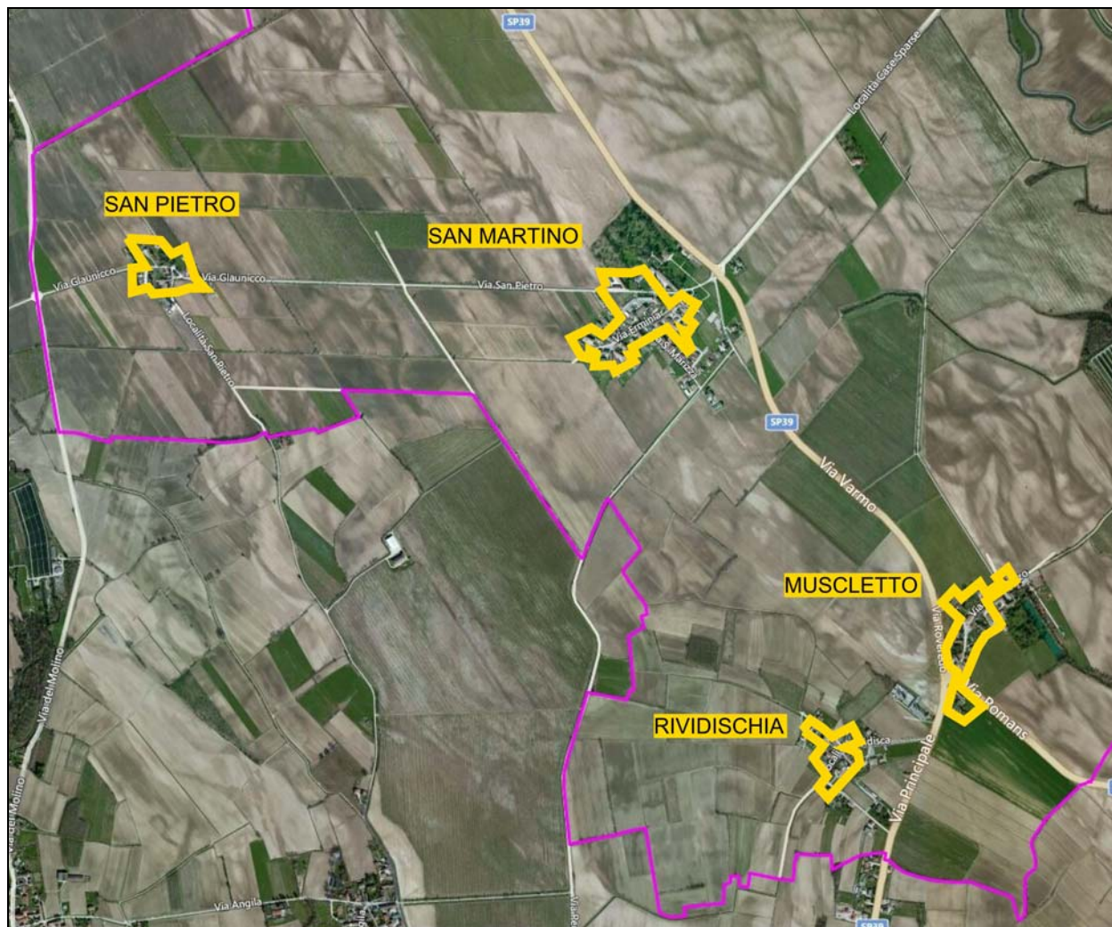
Ambiti soggetti a P.R.P.C. – Estratto foto aerea

Lo strumento attrattivo del P.R.P.C. dei centri storici di San Martino, Muscletto, San Pietro e Rividischia va ad interessare le Frazioni dei medesimi centri, posti a sud del centro abitato del Capoluogo e distribuiti prevalentemente in prossimità della Strada Provinciale S.P.39 "del Varmo".